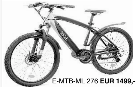
E-MTB-ML 276 EUR 1499,-

Aktions-Lagerverkauf... ...donnerstags und freitags, 14:00 bis 18:00 Uhr... ...samstags, 10:00 bis 15:00 Uhr.