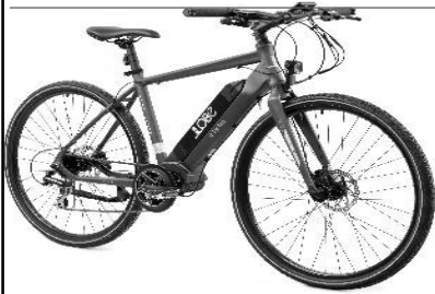
E-Trekking Cross Urban EUR 1499,-