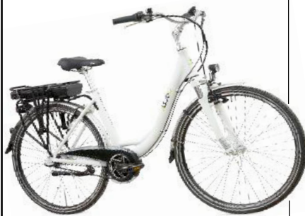
E-City Bike Streetglider EUR 1099,-

Super-Sommer-Schnäppchen im ELMPTER Lager-Verkauf 10% Nachlass