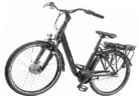
E-City Bike Devron EUR 1599,-

LLlobe GmbH & Co.KG - c/o P&M - Halle 2, Alte Zollstraße 26 - 28, 41372 Niederkrüchten Tel. 02163 - 571 35 20 / Fax 02153 - 91 05 07, eMail service@lllobe-bike.de